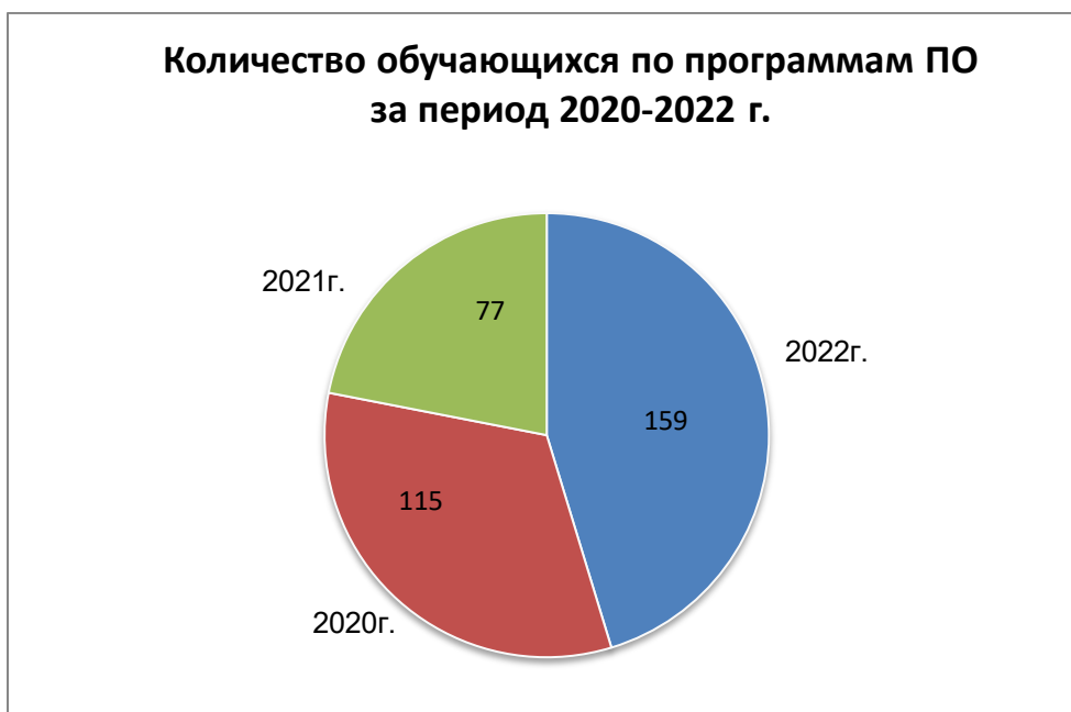
Рисунок 3 - Динамика численности обучающихся по программам профессионального обучения

Динамика численности обучающихся по программам профессионального обучения представлена на рисунке 3.